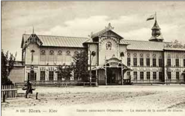
Беседка Киевского общества поощрения рысистого коннозаводства. 1890-е