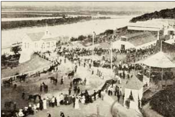
Общий вид конской выставки в Киеве. 1913

ить ипподром на Печерском плацу. При этом начальник штаба Киевского военного округа и одновременно один из 20 учредителей общества генерал-лейтенант А. И. Косич 13 апреля 1885 г. сообщил городской управе, что он не возражает против разбивки ипподрома на Эспланадной (Суворова) улице. И уже 5 июля князь Репнин получил официальное разрешение строить по представленному проекту деревянную беседку ипподрома (так тогда называли трибуны для зрителей). Она, отмечала газета «Киевлянин», была выполнена в русском стиле.