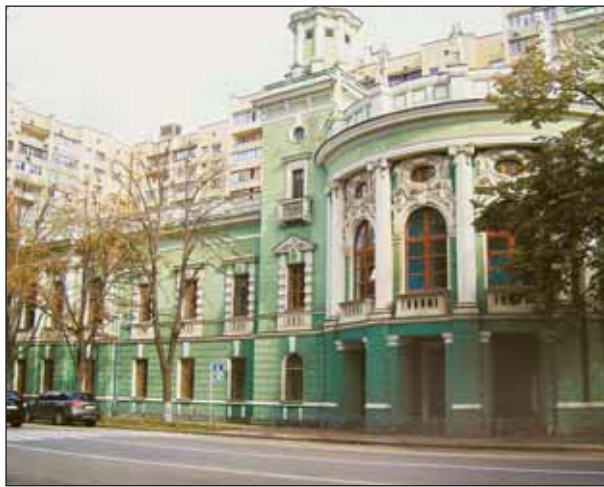
Бывшее здание ипподрома на Печерске. 2012