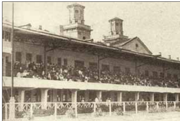
Трибуны ипподрома. 1946